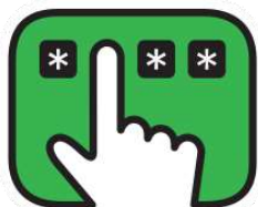
Chip and PIN

• Es la forma segura de pago con el chip de tu tarjeta y tu clave secreta.